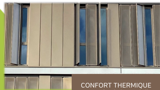
CONFORT THERMIQUE avec des brise-soleil

En vous implantant au CEI 4, vous rejoignez les 40 entreprises déjà présentes au sein de nos CEI, bénéficiez de services mutualisés et disposez des clés pour votre développement.