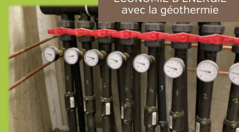
ÉCONOMIE D'ÉNERGIE avec la géothermie

De plus, des bornes pour véhicules électriques sont disponibles. L'utilisation de modes doux est facilitée avec la mise à disposition de garages à vélo sécurisés et la proximité immédiate du tramway.